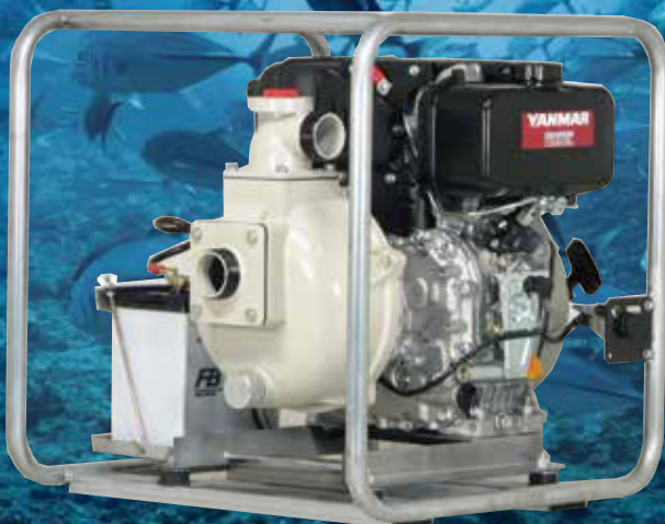
QP-205SLD /L70MRN CP