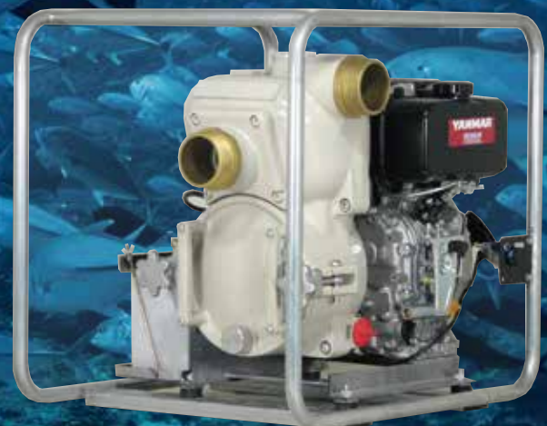
QP-301TD /L70MRN CP